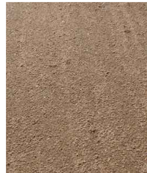
P8 Sport surface/ Спортивная поверхность