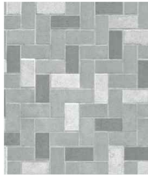
P2 Concrete pavement/ Бетонное покрытие